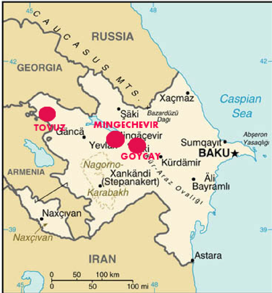
Xəritə 1. Qiymətləndirmənin əhatə etdiyi bələdiyyələrin yerləşməsi