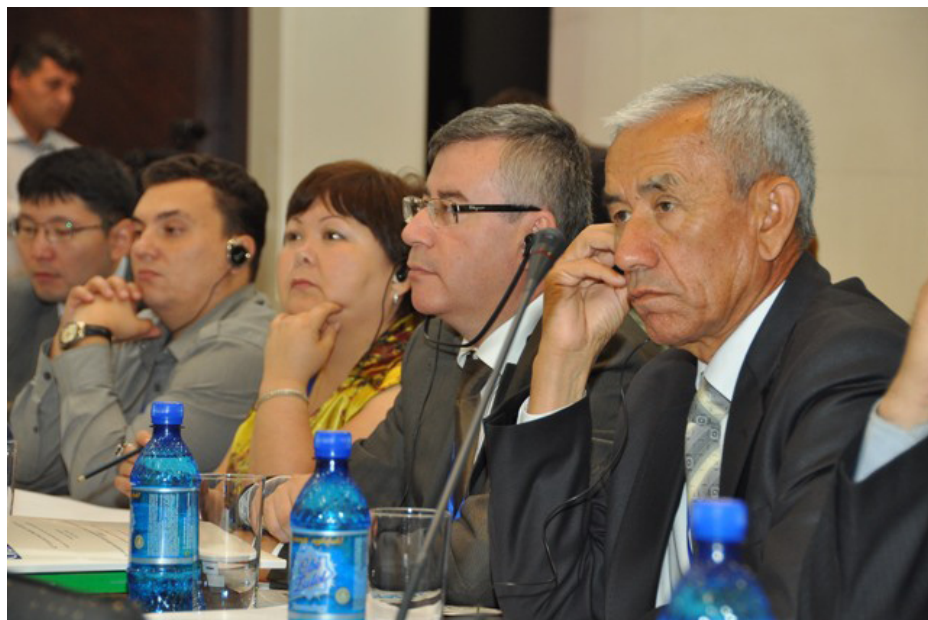
Участники конференции из Центральной Азии