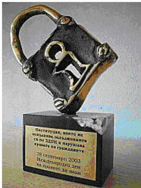
Рисунок 2. Болгарская премия для наиболее закрытой государственной структуры