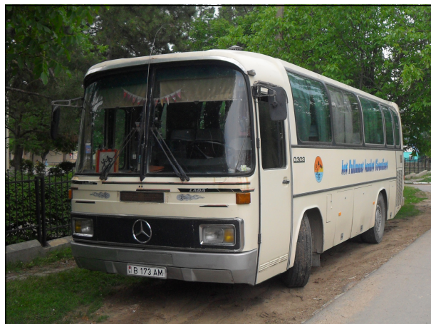
Школьный автобус для учеников Теоретического лицея “Штефан чел Маре ши Сфынт” (Григориополь /Дороцкая)

Ученики Теоретического лицея “Штефан чел Маре ши Сфынт” (Григориополь/Дороцкая) проходят приднестровские контрольно-пропускные пункты каждый день (маршрут Григориополь / Делакэу / Красногорка – Дороцкая), для посещения школы в селе Дороцкая. Они ездят в автобусах, арендованных лицеем, без контроля и проверки документов.