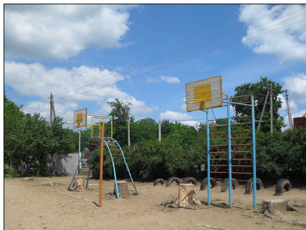
Игровая площадка Гимназии села Коржова

Краткая история. Коржова – одно из сел на левом берегу Днестра, за которое во время конфликта 1992 года шли особо ожесточенные бои. Юрисдикция над селом по сей день является предметом спора между сторонами. Приднестровские де-факто власти считают Коржова пригородом контролируемых ими Дубоссар, как это было в советские времена, а молдавские власти считают Коржова отдельным селом, находящимся под их юрисдикцией. В селе присутствуют и силы полиции Молдовы, и силы милиции Приднестровья.