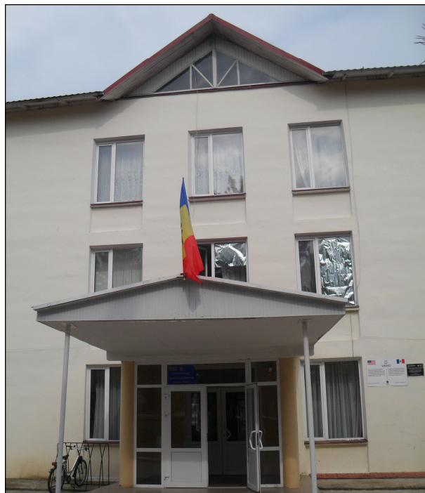
Теоретический лицей “Штефан чел Маре ши Сфынт” (Григориополь /Дороцкая)

Краткая история. Молдавская школа №1 в Григориополе, как и другие школы Молдавской ССР, перешла на латиницу после 1989 года. К 2001/02 учебному году число учеников увеличилось до 709 (см. Таблицу 1). В 1992 году школа перешла под контроль Приднестровья и была вынуждена принять кириллицу. Директор был уволен.