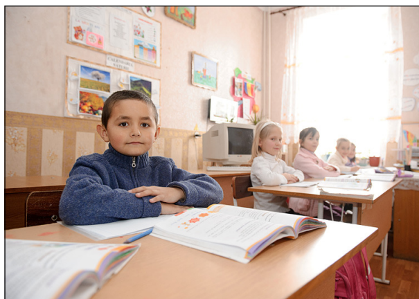
Ученики Теоретического лицея “Лучиан Блага”, Тирасполь

Вопрос согласования учебных программ был одним из самых чувствительных в процессе переговоров по проблемам школ с латинской графикой. Тем не менее, в разное время он обсуждался достаточно подробно, и были достигнуты различные компромиссы.