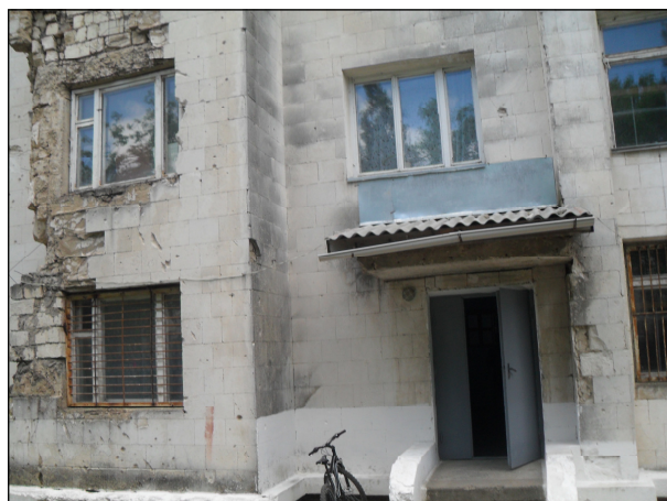
Временное здание Теоретического лицея “Михай Еминеску” в Кочиерах

Краткая история. Молдавская школа №3 в Дубоссарах, как и другие школы Молдавской ССР, перешла на латиницу после 1989 года. В 1992 году школа оказалась под приднестровским контролем, начала преподавание на кириллице и функционировала как молдавско-русская школа. Тем не менее, некоторые родители и учителя по-прежнему желали продолжать образование на латинской графике. Также в школе отмечались напряженность и конфликты между детьми, обучавшимися на молдавском и русском языках.