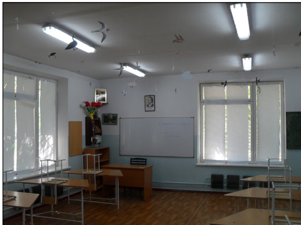
Класс в Теоретическом лицее “Александру чел Бун”, Бендеры

Краткая история. Школа №19 в Бендерах была основана в сентябре 1988 года и являлась единственной в городе школой с преподаванием на молдавском языке. Она располагалась в помещениях, принадлежащих русской школе №1. С 1989 года образование в школе стало вестись на латинице, как и в других образовательных учреждениях Молдавской ССР. После того, как Приднестровье провозгласило независимость, школа отказалась вернуться к кириллице.