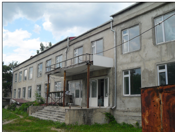
Одно из зданий по адресу ул. Гагарина 14, Рыбница, построенное за счет Министерства просвещения Молдовы

Краткая история. До 1983 года в Рыбнице существовала только одна русско-молдавская школа. В 1989 году на территории детского сада №13 открылась новая молдавская Школа №12. Здание сада вскоре перестало вмещать учеников, количество которых быстро росло. 74