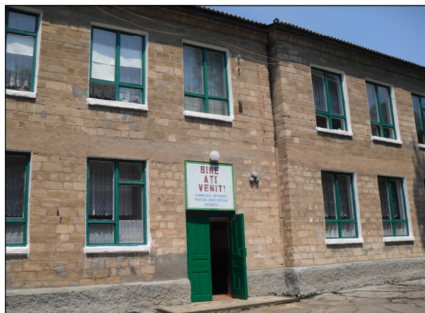
Школа-интернат для детей-сирот, Бендеры

Краткая история. Школа-интернат для детей-сирот в Бендерах (далее – школа-интернат) была основана в 1957 году. В 1992, 1996, 2002–2003 и 2004 годах приднестровские де-факто власти пытались взять школу-интернат под свой контроль. Учителя и дети сопротивлялись этим попыткам.