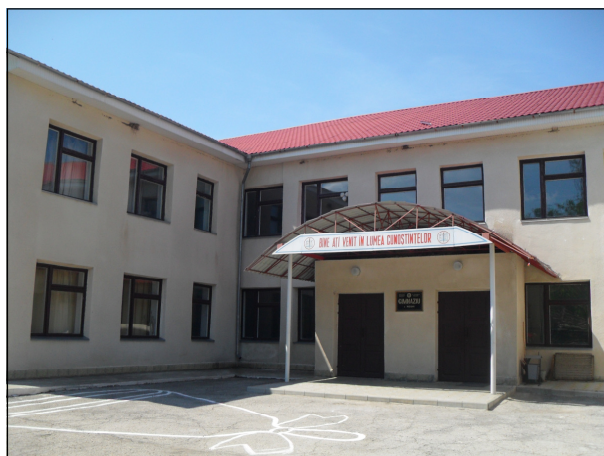
Гимназия села Роги

Краткая история. После 1989 года школа в Рогах, как и другие школы Молдавской ССР, перешла на латиницу. В 1991 строительство нового здания школы было почти завершено при финансировании со стороны Правительства Молдовы. Однако в этом году село оказалось под контролем Приднестровья. Новые де-факто власти завершили строительство здания, но также ввели в школе кириллицу. Родители и учителя выступили с протестом, но власти уволили директора школы и сохранили в школе кириллицу.