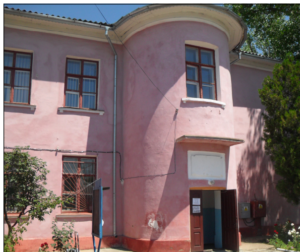
Теоретический лицей “Лучиан Блага”, Тирасполь

Краткая история. В 1989 году, после принятия в Молдавской ССР закона о языках, в одной из русско-молдавских школ Тирасполя началось преподавание на молдавском языке с латинской графикой. 1 сентября 1991 года администрация города Тирасполя приняла постановление, согласно которому была основана школа №20, первая тираспольская школа с преподаванием на молдавском языке (с латинской графикой).