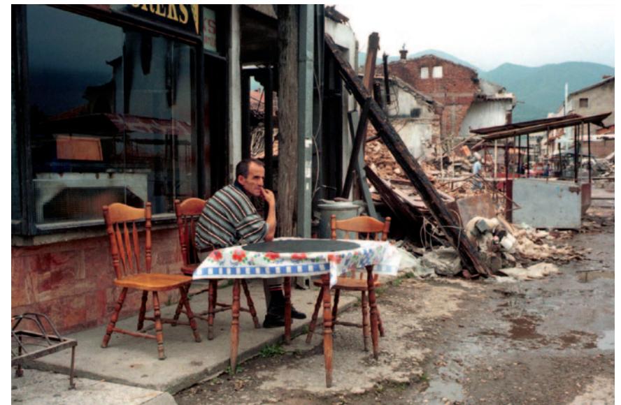
Возвращение владельца магазина в разрушенную деревню Пейя/Печ (Косово). Лето 1999.