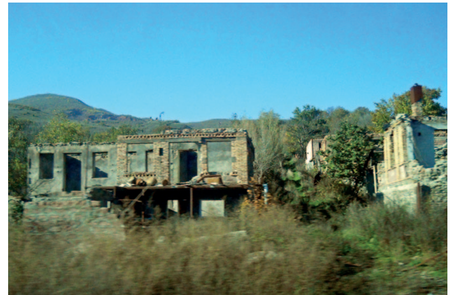
Руины домов, в которых ранее проживали грузины, деревня расположена севернее Цхинвала. Ноябрь 2011 г.