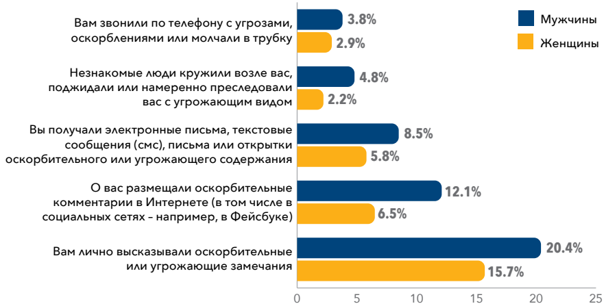
Рис. 1. Доля еврейских мужчин и женщин, в последние 12 месяцев сталкивавшихся с различными видами антисемитских инцидентов. Респондентов просили ответить, сталкивались ли они с ситуациями, описанными выше.

На представленных ниже диаграммах, взятых из указанного исследования, видно, насколько разное воздействие может оказывать антисемитизм на мужчин и женщин.