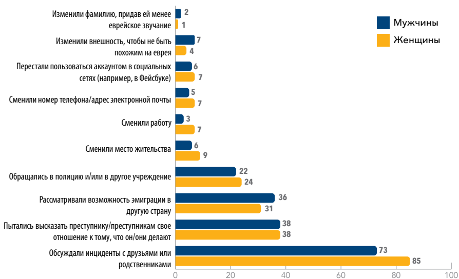
Рис. 3. Доля мужчин и женщин, которые предпринимали различные шаги, лично столкнувшись с проявлением антисемитизма.