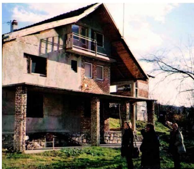
Sigurna kuća u Banja Luci, 2003. Novokupljena kuća, kasnije adaptirana kao sklonište za žene i djecu preživjele nasilja

Takođe je bilo veoma važno uspostaviti dijelov između žena iz svih dijelova BiH i između ljudi iz svih etničkih grupa . Povezivanje sa drugim ženskim grupama u BiH doprinijelo je sprečavanju trgovine ženama, boljem odgovoru na nasilje u porodici i radu na izgradnji mira.