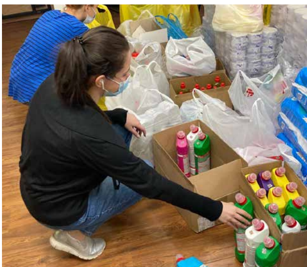
Organizovanje i distribucija paketa podrške u Jermeniji

Veoma stvarni problemi djevojaka i žena sa menstruacijom se izgleda ignorišu u mnogim zemljama širom svijeta, kada je objektiv kroz koji se pruža humanitarna pomoć patrijarhalan i nedovoljno rodno osjetljiv.