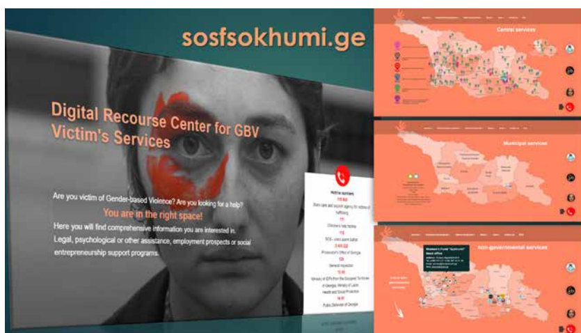
Početa stranica Digitalnog resursnog centra servisa za žrtve rodno zasnovanog nasilja

"Digitalni resursni centar za preživjele nasilja u porodici" 77 (Online platforma) je uspostavljena od ŽFS 2022. godine kako bi se osigurao jednostavan pristup za preživjele nasilja u porodici i zainteresovane profesionalce širokom spektru informacija u vezi sa rodno zasnovanim nasiljem/nasiljem u porodici. Online platforma je sveobuhvatna banka informacija o svim postojećim uslugama podrške za preživjele, koje pruža ili vlada Gruzije na nacionalnom i lokalnom nivou, ili organizacije civilnog društva; informacije o mehanizmima pravne zaštite za preživjele nasilja, funkcije aktera referalnog sistema, nacionalne i međunarodne publikacije koje se odnose na rodno zasnovano nasilje (izveštaji, analize, ankete, itd.), mobilne SOS aplikacije i brojevi telefona za pomoć, uspješne priče žena koje su preživjele nasilje su objedinjene u online platformu. Do sada je 10 opština integrisalo Digitalni resursni centar u svoje web stranice. Objavljeni su brojni Fejsbuk postovi, vijesti i članci u onlajn novinskim agencijama, a lične uspješne priče preživjelih rodno zasnovanog nasilja su pripremljene i objavljene na različitim blogovima i šire se putem društvenih medija. Medijske kampanje i informativni sastanci sa različitim društvenim i profesionalnim grupama, zajedno sa detaljnim uputstvima o tome kako da koriste platformu i izgradnja kapaciteta