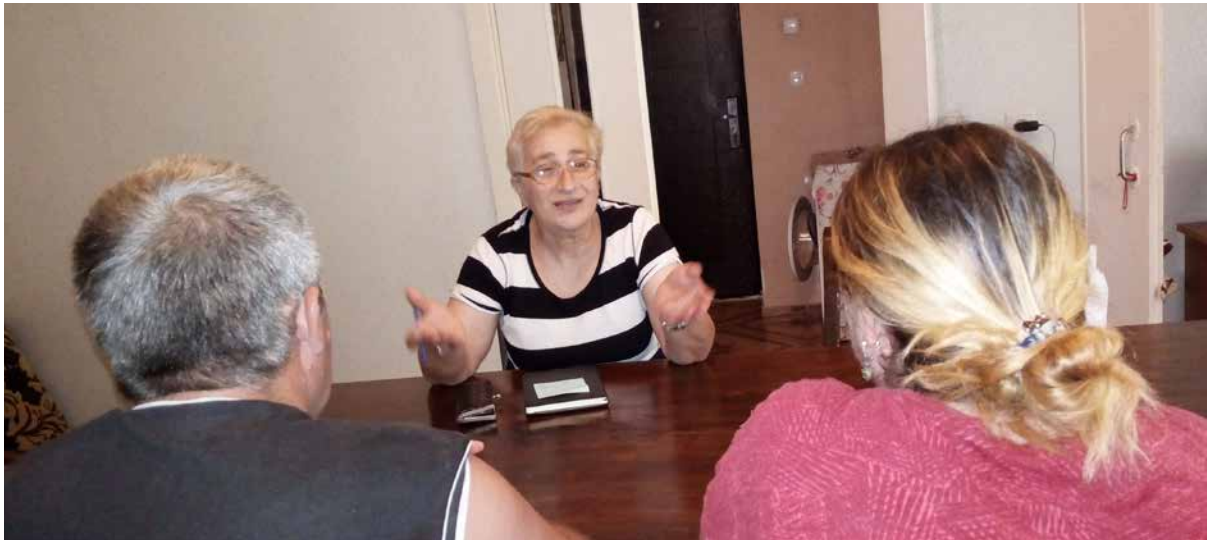
Rad sa parom u Ženskom fondu Sukumi

Ispostavilo se da imam mnogo problema...psihološkinja i socijalna radnica su razmišljale i pomagale mi da riješim ove probleme. Stručnjakinje su se brinule o meni i mojoj djeci. Poslije rada sa psihološkinjom sam osjećala olakšanje. Sada želim da iz svog uma izbrišem 31 godinu punu bola i nedaća, gdje nije bilo niti jedne svijetle tačke. Za dvije sedmice, stala sam na svoje noge, preispitala svoj život i pogledala na njega drugim očima. Naučila sam mnogo i sada se ne bojim sutrašnjice.