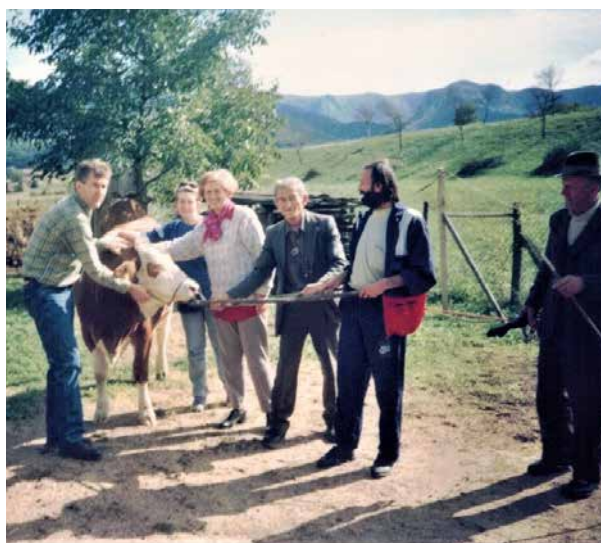
Entitetska granica Republike Srpske i Federacije BiH, 1997. Aktivnosti Fondacije Udružene žene usmjerene na unapređenje ekonomskog osnaživanja u seoskim područjima.