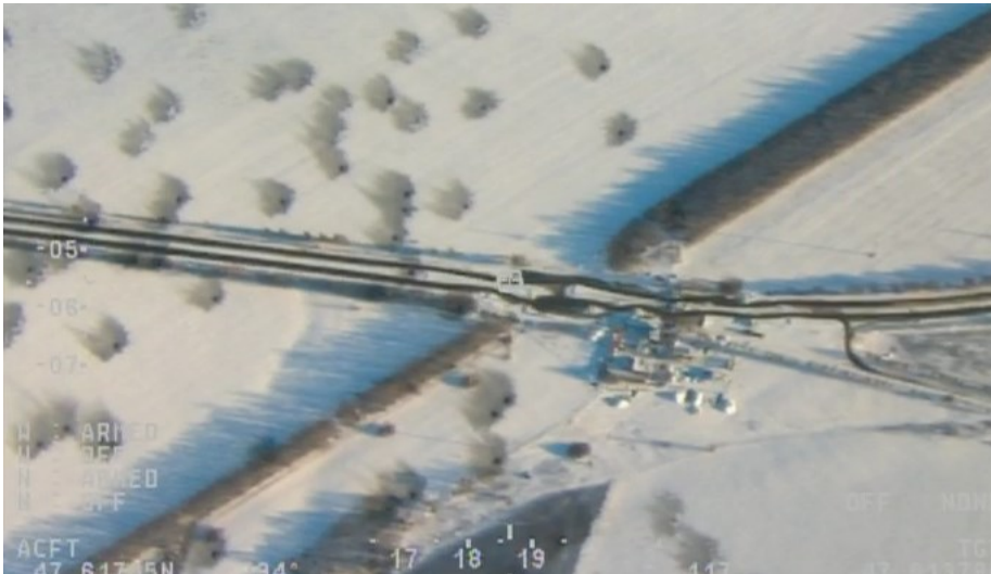
Фотография с беспилотного летательного аппарата (БПЛА) СММ, 14 января 2015. Воронки от ударов ракет на месте обстрела автобуса в Волновахе.