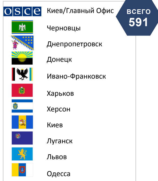
Наблюдатели СММ находятся в десяти городах Украины, главный офис — в Киеве.