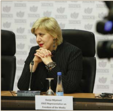
Дунья Миятович

«Не существует безопасности без свободных СМИ и свободы выражения мнений, как не существует свободы выражения мнений и свободы СМИ без безопасности. Эти понятия должны находиться в тесной связи, а не противопоставляться друг другу, как это происходит во многих частях мира. И нет более подходящего места для обсуждения и отстаивания этих двух ценностей, чем ОБСЕ. Безопасность и права человека лежат в основе Хельсинкского процесса и Астанинской юбилейной декларации, а также принципов и обязательств ОБСЕ, которые нас объединяют.