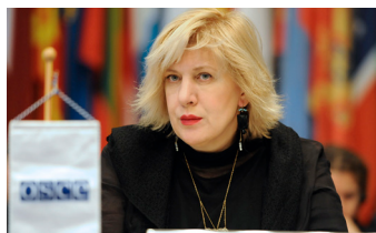
Представитель ОБСЕ по вопросам свободы СМИ Дунья Миятович на заседании Постоянного совета в Вене 16 января 2014 года

с вопросами безопасности журналистов и развития новых медиа, включая распространение цифрового вещания, конвергенцию СМИ и Интернет.