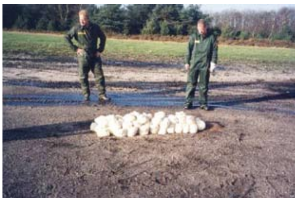
Figura 3.2: Sacchi contenenti propellenti pronti per la combustione a cielo aperto.

La combustione a cielo aperto viene utilizzata soprattutto per la distruzione delle eccedenze di propellenti (grandi quantità) e di composizioni pirotecniche. Anche gli esplosivi non confinati (grandi quantità) possono essere distrutti con questa tecnica, preferibilmente in piccole quantità, per evitare che la combustione di esplosivi e propellenti si trasformi in una vera e propria detonazione.