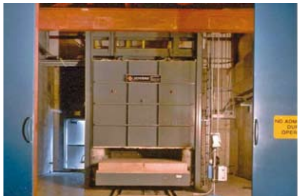
Figura 4.4: Forno a carro con porta semiaperta.

Questo tipo di forno viene utilizzato per il trattamento termico di munizioni (parti) di piccolo calibro quali accenditori, detonatori e spolette in piccoli quantitativi, mentre per grandi quantitativi si ricorre al forno rotativo. Il forno a carro viene anche impiegato per il trattamento termico dei rottami metallici contaminati da piccole quantità di esplosivo. In genere, il forno a carro viene utilizzato unitamente ad altre installazioni, quali un altro tipo di forno. Il calore necessario al riscaldamento del forno è generato dal calore in eccesso prodotto dal forno più grande.