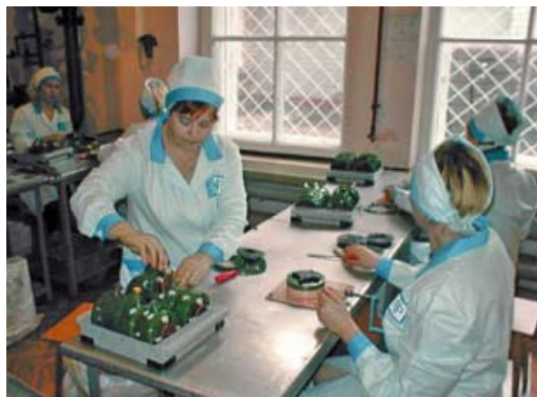
Fig. 5.1: Disassemblaggio manuale di mina antiuomo (Donetsk, Ukraina)

La riduzione può essere effettuata mediante una giusta combinazione di strumenti e personale qualificato. Per il disassemblaggio meccanico si fa ricorso a sistemi ad