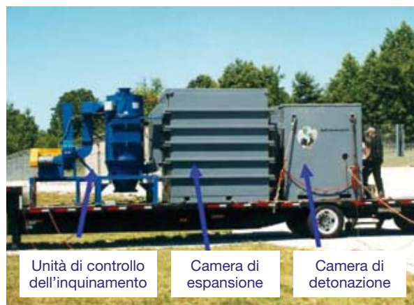
Figura 4.6: Versione mobile della camera di detonazione con unità di controllo anti-espansione e anti-inquinamento atmosferico.

Questo tipo di installazione viene impiegata per la distruzione delle munizioni tramite detonazione per simpatia. Il principio sfrutta la detonazione per simpatia di una piccola carica di esplosivi, soprattutto esplosivi plastici, posizionata a stretto contatto con le munizioni da distruggere. La camera è progettata per sopportare la sovrappressione generata dagli esplosivi di detonazione, ma non riesce a resistere alla forza dirompente delle detonazioni circostanti. Il carico massimo di esplosivi che possono essere detonati contemporaneamente dipende dalle dimensioni e dalla struttura della camera di detonazione. Detta camera è ottimale per lo smaltimento di piccoli quantitativi di munizioni di medio calibro, ivi comprese le granate a mano e le mine antiuomo. Per poter distruggere munizioni di calibro maggiore (proiettili maggiori di 105 mm) nella camera di detonazione è prima necessario sottoporle a riduzione.