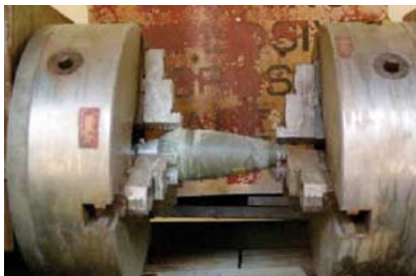
Figura 5.2: Torno per il taglio di un mortaio da 81mm

La riduzione può essere ottenuta oltre che con il tornio, segando o tagliando la munizione in parti più piccole, a patto che vengano prese tutte le precauzioni del caso. Le tecniche summenzionate possono essere eseguite in qualsiasi parte del mondo. Il loro utilizzo nell'ambito della procedura con linea di montaggio inversa può portare a situazioni rischiose, dato che le cariche esplosive sono sensibili alla frizione. È possibile scegliere il summenzionato metodo di riduzione solo se viene garantita l'incolumità del personale. Nella maggior parte dei casi, l'uso di processi controllati a distanza è sufficiente nonché obbligatorio al fine di garantire la sicurezza della procedura.