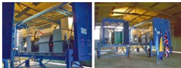
Figura 4.2: Sistemi mobili per la distruzione di munizioni impiegati dall'UNDP in Bosnia.

In Bosnia, l'UNDP sta utilizzando dei Sistemi mobili per la distruzione di munizioni (TADS). Detti sistemi possono essere ubicati ovunque al 25% dei costi di un forno rotativo fisso. I sistemi mobili consentono la distruzione di munizioni di piccolo calibro anche in grandi quantitativi.