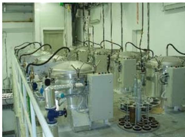
Fig. 6.1: Fusione del TNT con autoclavi presso l'impianto per l'eliminazione delle munizioni di Ankara

Le munizioni vengono riscaldate con acqua/vapore caldo o nei forni a induzione. Gli esplosivi fondono a temperature superiori agli 80,35^{\circ}\text{C} e fuoriescono dall'involucro. In seguito, gli esplosivi fusi vengono raccolti e sottoposti a ulteriore trattamento o eliminazione. Spesso vengo-