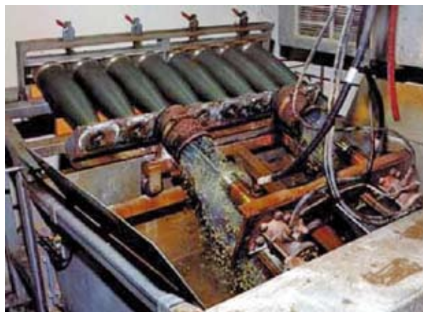
Figura 6.3: Lavaggio con getto d'acqua di proiettili da 155 mm

Il principio del lavaggio delle cariche esplosive con getto d'acqua sfrutta l'elevata pressione del getto. Il getto d'acqua viene orientato sulla carica esplosiva tramite un ugello rotante. Grazie al lavaggio con acqua ad alta pressione è possibile rimuovere ogni sorta di carica esplosiva dall'involucro metallico della munizione. Il lavaggio è particolarmente indicato per rimuovere composti al plastico (PBX) e altri esplosivi non fusi.