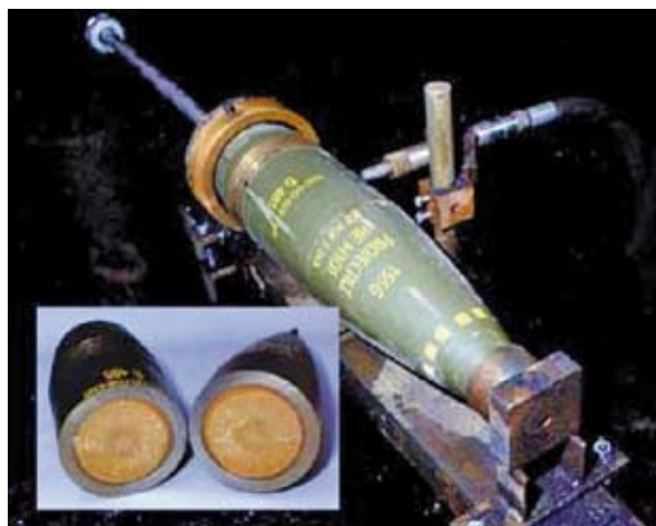
Figura 5.3: Attrezzatura per il taglio idroabrasivo. Nel riquadro in basso a sinistra, esempio di taglio su munizione da 155 mm.

missili. Si tratta inoltre di una tecnica sicura, operando entro determinati limiti di pressione. Il sistema HAC è particolarmente adatto per il taglio di munizioni contenenti esplosivi al plastico.