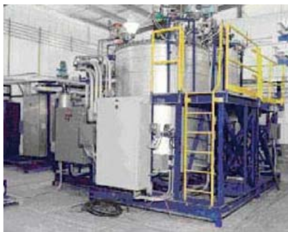
Figura 7.2: Impianto di biodegradazione

La biodegradazione sfrutta la capacità dei microrganismi di consumare gli agenti chimici contenuti nelle munizioni quali il TNT e altri esplosivi o componenti di propellenti. La biodegradazione può essere impiegata a guisa di un processo chimico in un'installazione simile a un reattore.