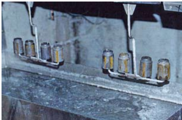
Fig. 5.4: Impianto per la frammentazione criogenica presso Alsetex, Francia

La frammentazione criogenica è ampiamente diffusa in Europa per la smilitarizzazione commerciale di unità e componenti contenenti piccoli quantitativi di esplosivo. Per effetto del congelamento gli esplosivi si desensibilizzano e possono così essere demoliti e quindi trattati in un forno. Decine di migliaia di bombe a grappolo sono state eliminate utilizzando questa tecnica.